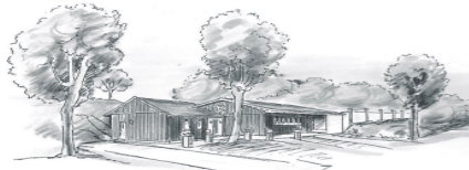
Schützenverein 1859 Bollstedt e.V.